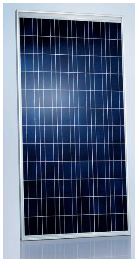
SCHOTT POLY™ 165/170/175/180